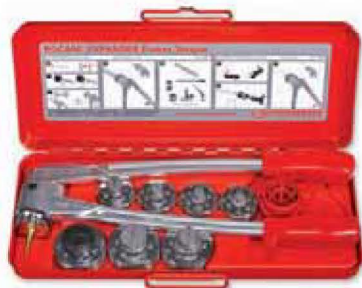
Set sadrži: ROCAM EXPANDER Power Torque klešta (No.12000), glave ekspandera, alat za uklanjanje spoljašnjih i unutrašnjih oštih ivica (No.11006), kutija (No.24022)

„Know-how“ od pionira tehnologije proširivanja i vodećeg proizvođača ekspandera već više od 40 godina.